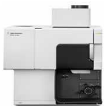
【NEW】Agilent 5110 ICP-OES