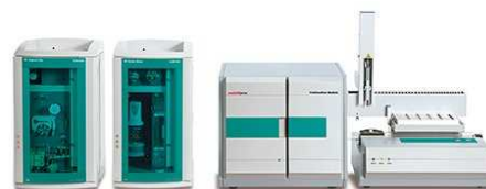
【NEW】燃焼法イオンクロマトグラフィー (CIC)

貴社ますますご盛栄のこととお喜び申し上げます。日頃より格別のご愛顧を賜り、厚く御礼申し上げます。この度、Agilent Technologies社の協力を得まして、ICP-OES新製品の紹介、ICP-MS新製品の紹介、各装置の最新アプリケーション情報のセミナーを開催させていただきます。今回は、GLサイエンス社、オルガノ社、メトローム社の協力もいただきまして無機分析に必要な前処理装置、超純水、イオンクロマトに関しての最新技術紹介を予定しております。年末に向けてご多忙の所とは存じますが、皆様のご参加を心よりお待ちしております。