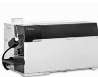
【NEW】Agilent 8900 ICP-QQQ